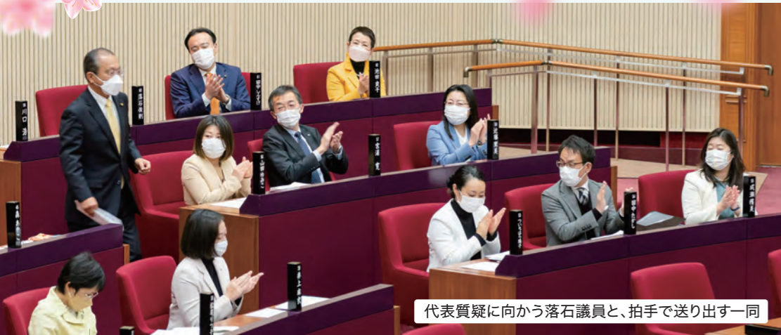
代表質疑に向かう落石議員と、拍手で送り出す一同